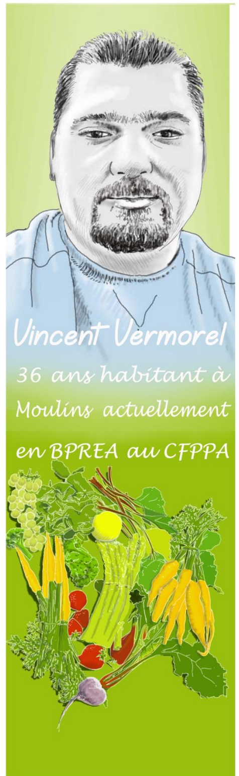
Vincent Vermorel 36 ans habitant à Moulins actuellement en BPREA au CFPPA